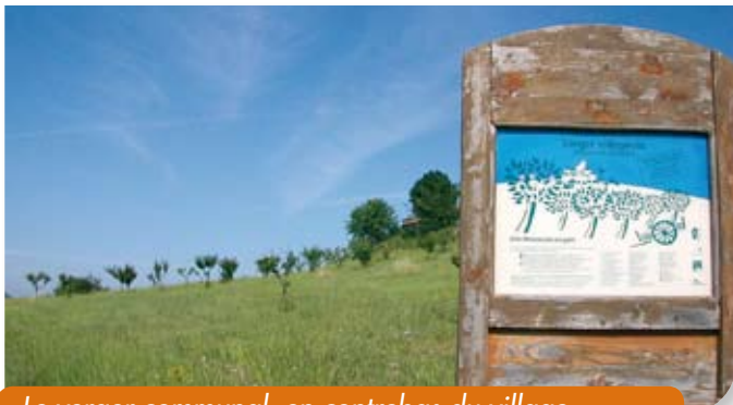
Le verger communal, en contrebas du village.

L'exemple des erreurs commises - en adoptant ce schéma - par l'ensemble des autres communes de la région (Pierrevet, Sainte-Tulle, Volx...), aurait pourtant dû nous encourager à suivre une autre voie.