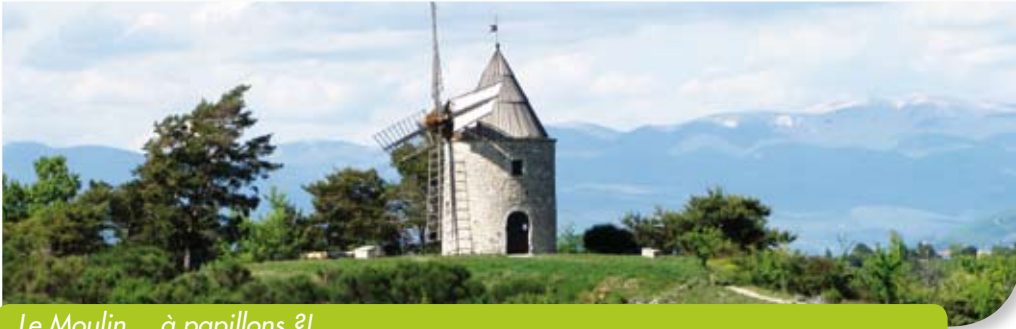
Le Moulin... à papillons ?!

Nous cherchions depuis quelque temps déjà comment interpeller les Montfuronais à propos du projet « Jardin à Papillons » porté par M. le Maire.