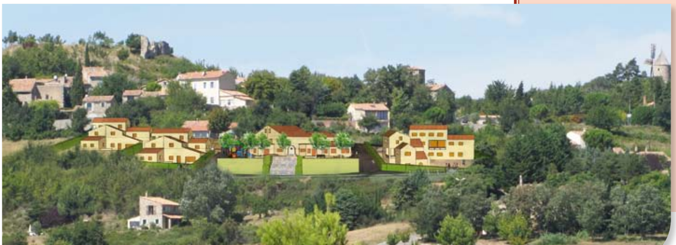
Un projet qui devra réussir une parfaite intégration à la silhouette du village, vue depuis la vallée de la Durance.