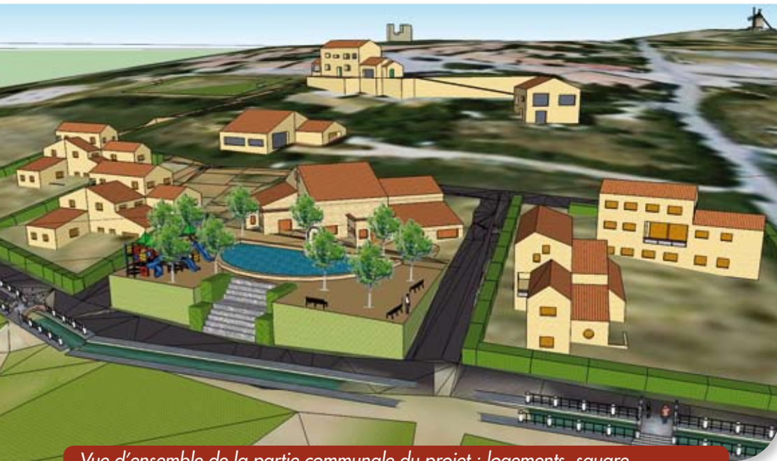
Vue d'ensemble de la partie communale du projet : logements, square...

Une seconde liaison serait également prévue , au cas où cet aménagement se poursuivrait sur les terrains privé entre la Mairie et le Verger, et suivrait le sentier qui existe déjà depuis l'ancien « point de vue/nouveau WC public ».