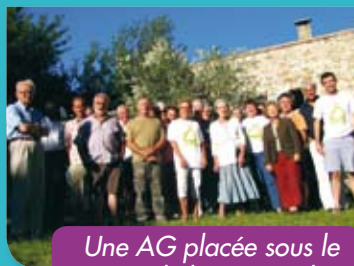
Une AG placée sous le signe de la convivialité

Il faut souligner votre importante participation (26 adhérents présents - soit la moitié des membres actifs). Parmi ceux qui n'avaient pas pu faire le déplacement, 8 d'entre vous avaient fait parvenir leur « pouvoir ». Ceci témoigne de l'intérêt que vous portez à votre association.