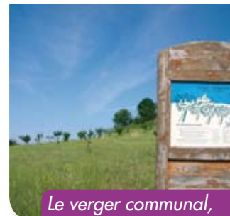
Le verger communal, en contrebas du village.

Cependant la question reste toujours d'actualité. Le maire promet de mener sur le sujet une concertation, large, à laquelle il nous associerait. Restons vigilant. ■ Théo Yabi