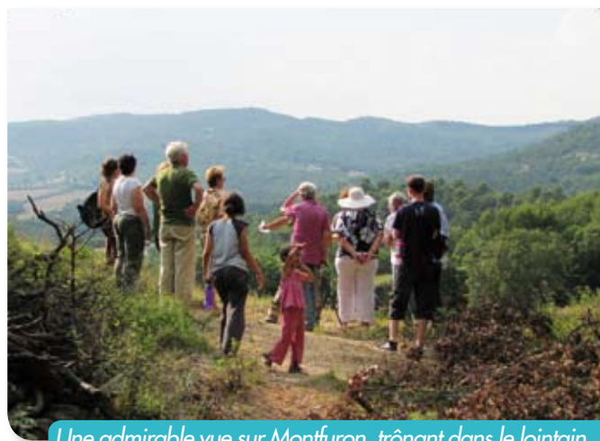
Une admirable vue sur Montfuron, trônant dans le lointain.

Puis ce fut l'arrivée au hameau des Criès, peut-être ainsi nommé parce que ses habitants avaient le devoir d'avertir de possibles attaques les gens de S te Marguerite et des environs.